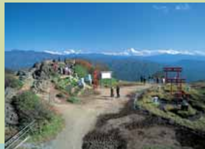
天神峠展望台からの眺望

谷川岳土合口から天神平まで、谷川岳ロープウェイで約10分。リフトを使い天神峠の展望台まで登ると眼下に大パノラマが広がります。特に紅葉の季節は圧巻です。