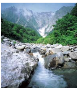
一ノ倉沢出合から、一ノ倉沢上部を見る。

谷川岳の象徴である一ノ倉沢は、アルプス的な山容を持ち、スケールの大きな岩壁、盛夏でも豊かな雪渓と、来るものすべてを圧倒する。山への憧れをかきたてられる魅力に満ちあふれた場所である。