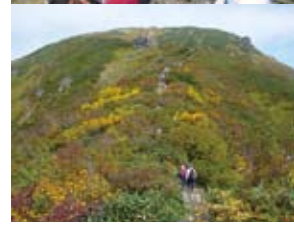
上/谷川岳・トマノ耳山頂(右はオキノの耳) 下/秋の天神尾根