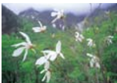
白い大きな花をつけるタムシバ

時間と体力に余裕があり、山登りの経験がある方は一ノ倉沢からさらに先の芝倉沢まで足をのばしてみよう。このコースは、しっかりとガイドがいるとより安心である。帰りは、湯輪曾川沿いの新道へ出て違う雰囲気を楽しむ。